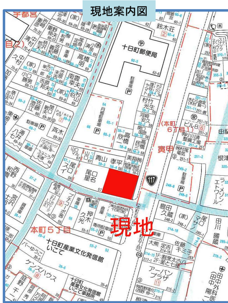
図面と現況に相違がある場合には現況優先とします。