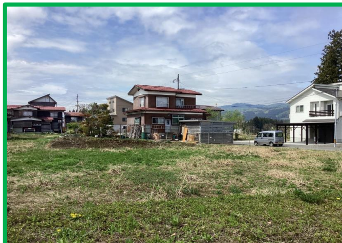
図面と現況に相違がある場合には現況優先とします。