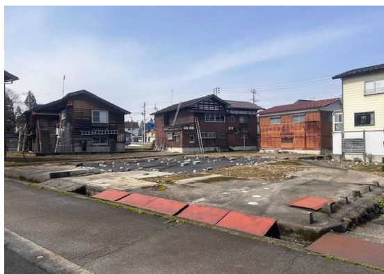
図面と現況に相違がある場合には現況優先とします。