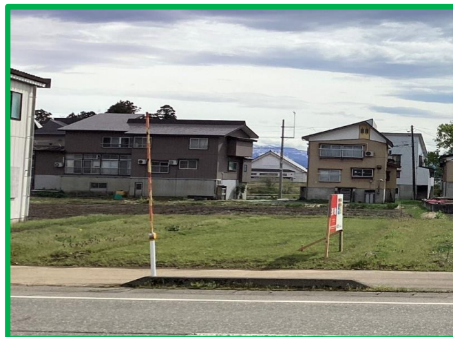
図面と現況に相違がある場合には現況優先とします。